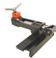
alat za spiralno savijanje