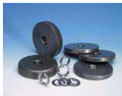
valjci za pravokutne i kvadratne cijevi

Proizvođač zadržava pravo izmjena na stroj bez prethodne najave. Slike su simbolične i mogu odstupati od isporučenog stroja. Strojevi se isporučuju bez postolja.