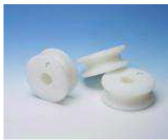
poliamidni valjci za INOX i mesing cijevi