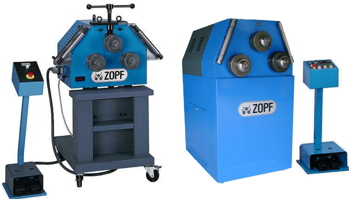
ZB 60 M ZB 60/3 MD